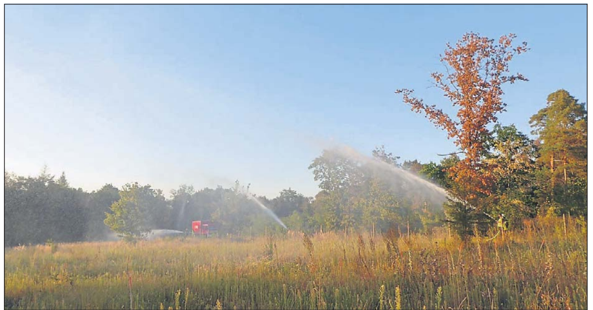
Voller Löscheinsatz auf dem Lenneberg.

Budenheim. – Am vergangenen Freitag hat die Freiwillige Feuerwehr Budenheim im Rahmen einer abendlichen Waldbrandübung an der Landstraße nahe der Reitschule eine eingezäunte Waldfläche, auf der im Herbst 2018 Eichen ausgesät wurden, beregnet. Aufgrund der anhaltenden Trockenheit war das nötig geworden, um die Eichensämlinge vor dem Vertrocknen zu bewahren. Für die Beregnung wurde kein Trinkwasser verwendet, sondern Wasser der Budenheimer Heßlerquelle, die vom Lennebergwald gespeist wird. Zwei Feuerwehrautos mit einem Fassungsvermögen von rund 3.500 Liter füllten im Pendelverkehr ein Wasserbecken, das bis zu 10.000 Liter aufnehmen kann. Aus dem Becken wurde das Wasser mit einer Motorpumpe über Schläuche zu den Feuer-