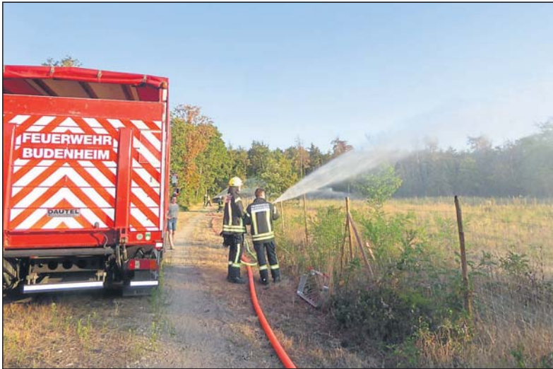
Feuerwehrfahrzeug im Einsatz einer Waldbrandübung.

den Klimawandel ändernden Klimabedingungen, also lange Trockenperioden statt regelmäßiger Niederschläge in Form von Landregen oder Gewitter, einstellen müssen, da Wälder im Gegensatz zu landwirtschaftlichen Kulturen nicht dauerhaft bewässert werden können.