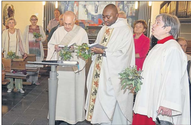
Segnung der Würzwische im vergangenen Jahr.