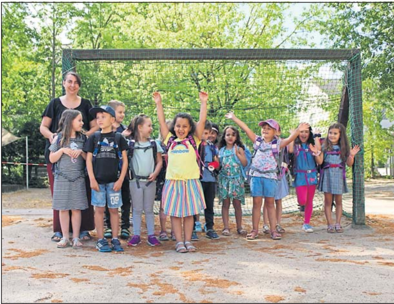
Großer Jubel. Alle Kinder haben die Präsentation geschafft.

Mit einem lachenden und einem weinenden Auge verabschieden die Erzieherinnen und Erzieher die Vorschulkinder in die Schule und wünschen alles Gute für den nächsten Abschnitt ihres Lebens.