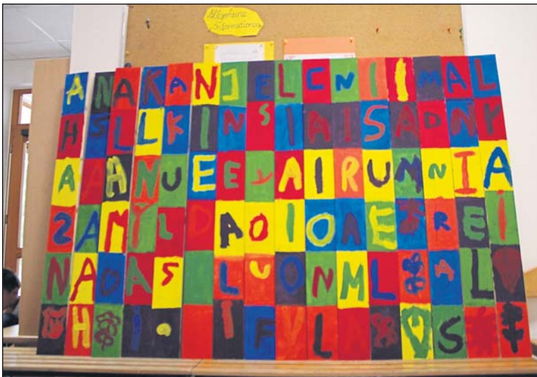
Das Abschiedsbild der Schlaufüchse.