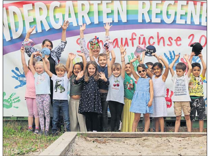
Die Schlaufüchse verabschieden sich.

ten Neues entdeckt und ihr Wissen zu einigen Themen vertieft. Zwei der Themen waren „Rund um den Würfel“ und „Die Geschichte vom kleinen Quadrat“. Das Wichtigste für die Vorschulkinder aber war es, dass sie ein letztes Mal ihre Kita und das Spielen mit ihren Freunden genießen konnten. Anders als in den letzten Jahren haben diesmal die Vorschulkinder die Schule dank eines Videos kennen gelernt. Die Lehrerinnen der Lenneberg-Schule haben einen Film über die Schule für sie gedreht, den sich die Schlaufüchse mit großer Neugier angeschaut haben. Dabei bekamen sie die Briefe von ihren zukünftigen Paten aus der Schule, was die Vorfreude auf die Schule zusätzlich