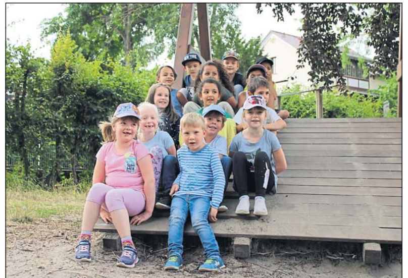
Die kleinen Zuschauer.