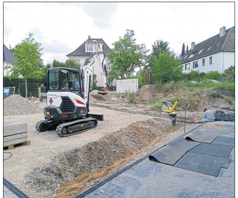
Grabenarbeiten im Außenbereich.

Die TGM Budenheim zeigt's! Mit uns bauen, renovieren und sanieren Sie erfolgreich!