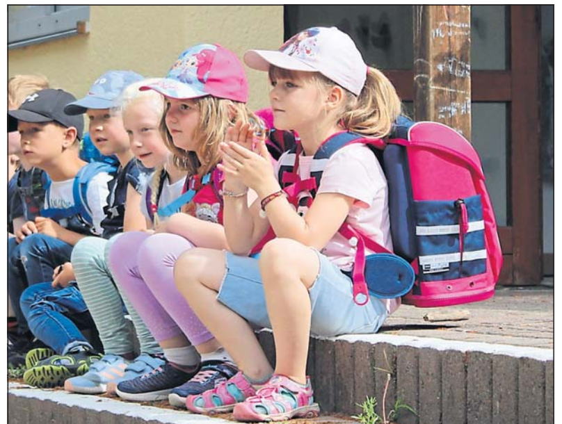
Große Spannung vor der Schulranzenpräsentation.