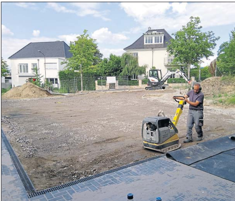
Fertigstellung der Tragschicht.

Die nächsten Einsätze sind über die Wochenenden im August, jeweils Freitag und Samstag geplant. Die genauen Termine werden per Mail und auf der Homepage bekannt gegeben.