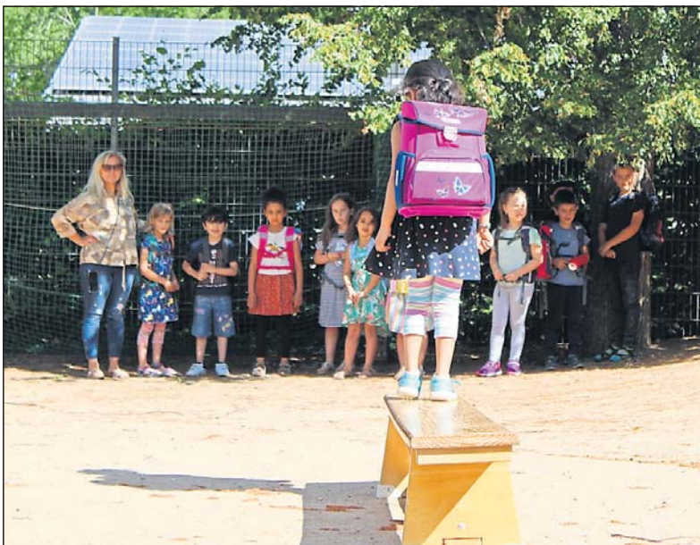
Der Schulranzenlaufsteg für die Schlaufüchse.