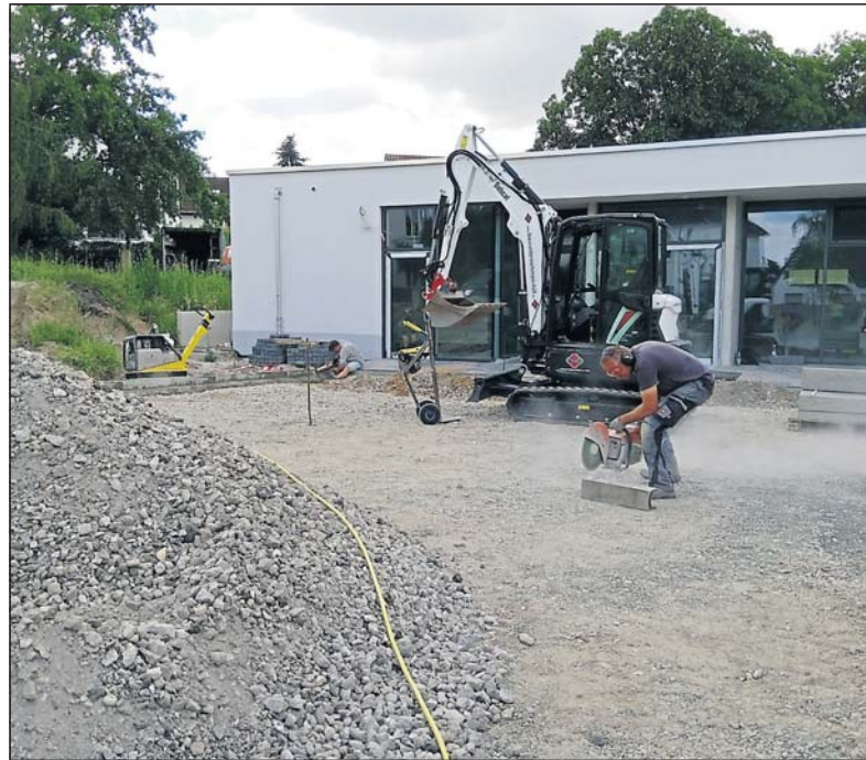
Bearbeitung der Pflastersteine.

Die Gestaltung und Ausführung der Außenanlage hat die TGM in Eigenregie übernommen, um hierdurch eine Einsparung für das Gesamtbudget zu erreichen. Das ist mit viel Handarbeit und anstrengendem körperlichem Einsatz verbunden. Manchmal geht es aber nicht ohne Maschineneinsatz. Mit den Firmen Hiill und Korfmann Gartenbau hat die TGM glücklicherweise zwei zuverlässige Partner, die bei diesen Arbeits-