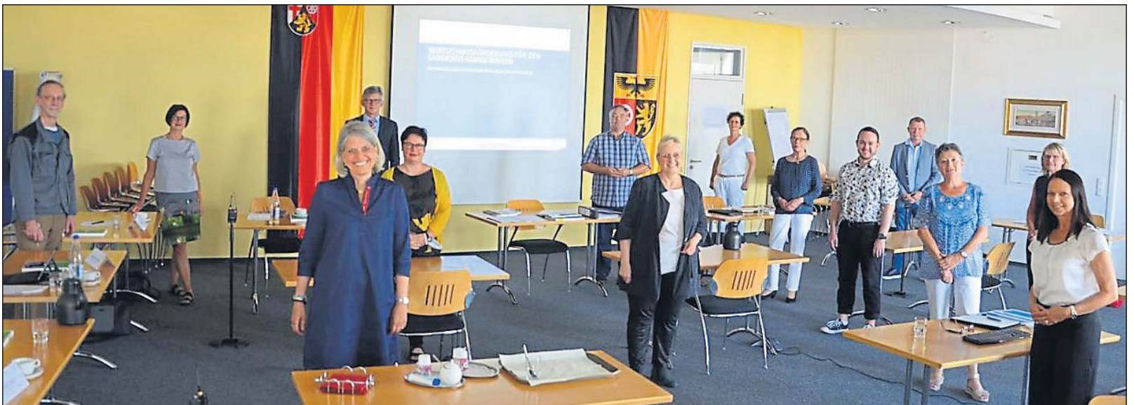
Der Wirtschaftsbeirat Mainz-Bingen nimmt die Arbeit auf.

standort gehen Herausforderungen einher, die sich ändernde wirtschaftliche, gesellschaftliche, technologische und ökologische Rahmenbedingungen mit sich bringen. Der Wirtschaftsbeirat erfüllt beratende Funktion und wird mit Impulsen die Wirtschaftsförderung in der Region sowie die Gremien bei ihrer Arbeit unterstützen. Netzwerkarbeit oder gemeinsamer Austausch mit Experten sollen weiter das Standortmarketing in Rheinhessen, im Mittelrheintal und dem Naheland stärken.