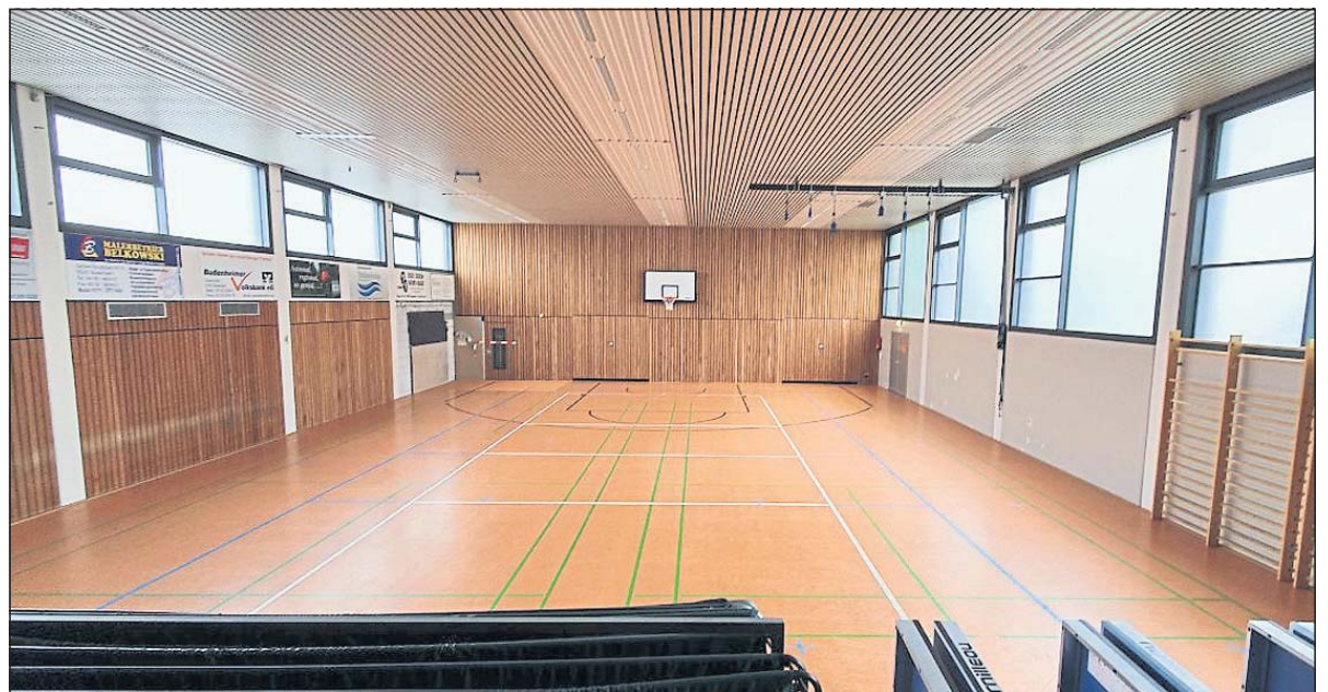
Die ersten Gruppen beleben bereits wieder die Halle.