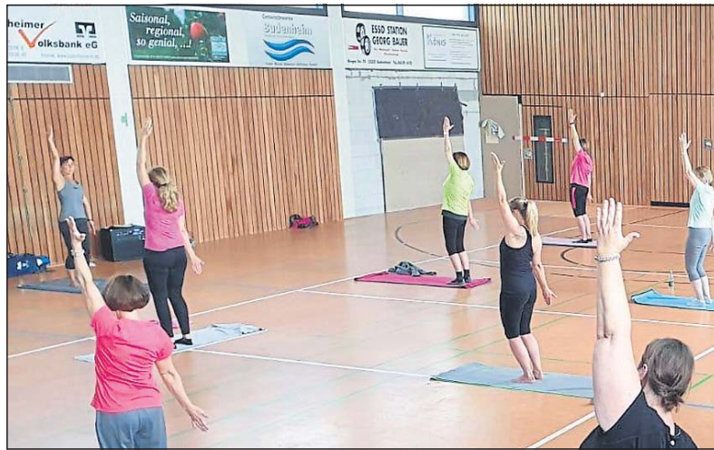
Die Halle der Turngemeinde ist startklar für den Re-Start.

Wenn nach der Aufnahme des Kindersports auch bald wieder die Standardangebote starten können, wäre der letzte Schritt des Re-Starts geschafft.