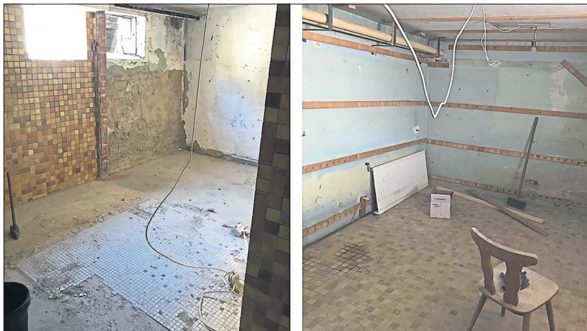
Aufgrund der Corona-Krise und der damit verbundenen Fußball-Zwangspause hat der FV Budenheim im Mai dieses Jahres mit dem 2. Bauabschnitt, der Sanierung der Umkleidekabinen und den Duschen begonnen. Im 1. Bauabschnitt wurden bereits die Toiletten und die Schiedsrichterkabine saniert und erneuert, berichtet Frank Dörr, 1. Vorsitzender des FV 1919 Budenheim e.V.. Unsere Bilder vermitteln einen Stand der Arbeiten.

platz der Waldsporthalle (aktuell nur mit zwei Personen je Gruppe mit Abstand). Weitere Infos gibt es auch im Internet unter www.skiundfreizeit.djk-sfb.de .