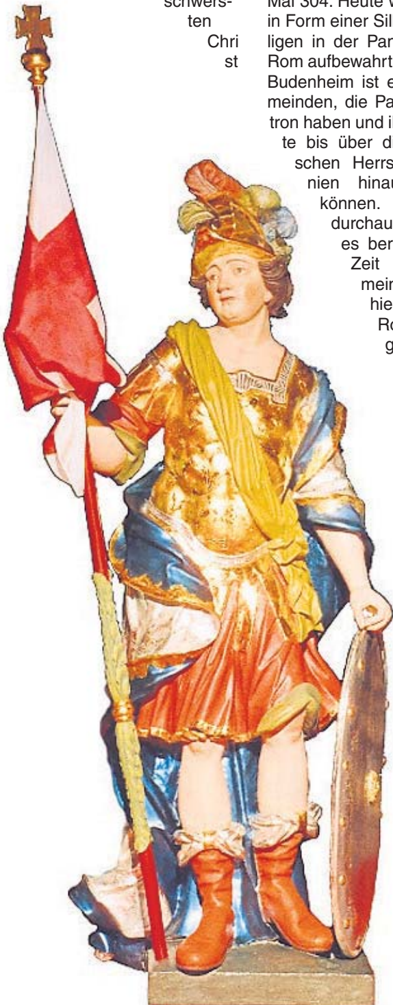
Die Statue des Hl. Pankratius, so wie sie in der Dreifaltigkeitskirche zu sehen ist.

Der Hl. Pankratius gilt heute als Patron der Kinder, der Jugend und der Kranken. Als Schützer der jungen Saat und der Blüte wird er als Eiseheiliger verehrt. Er wurde nicht nur zum Schutzpatron der Budenheimer Kirche erwählt, sondern für ganz Budenheim: Pankratius ist als Ritter im Wappen von Budenheim zu sehen.