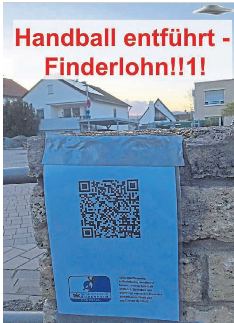
Wer findet den Startpunkt der digitalen Schnitzeljagd auf dem Budenheimer „Platz der Generationen“?

Unsere telefonische Anzeigenannahme erreichen Sie Montag bis Donnerstag von 8 bis 12 Uhr unter Telefon: 06722/9966-0