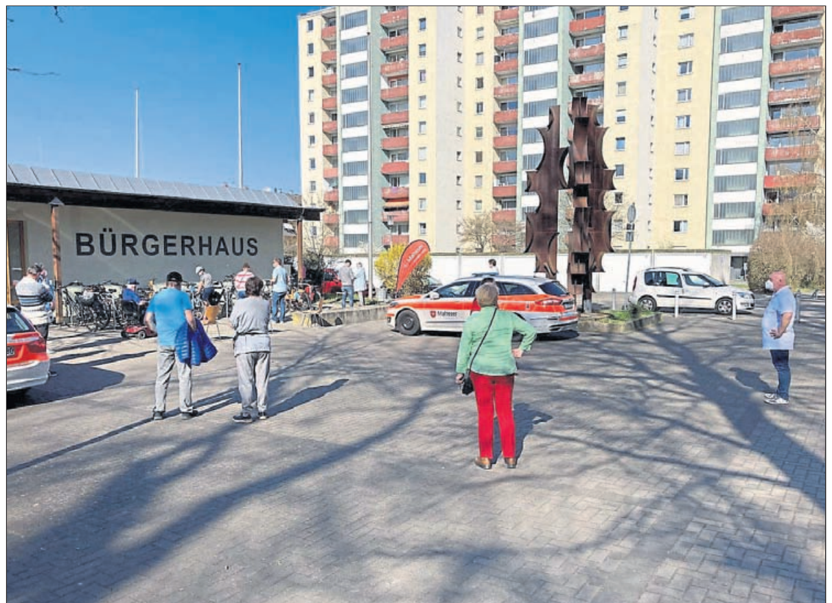
Vor dem Testzentrum stehen die Leute bereits an.

Am 30. März war es im Budenheimer Bürgerhaus soweit